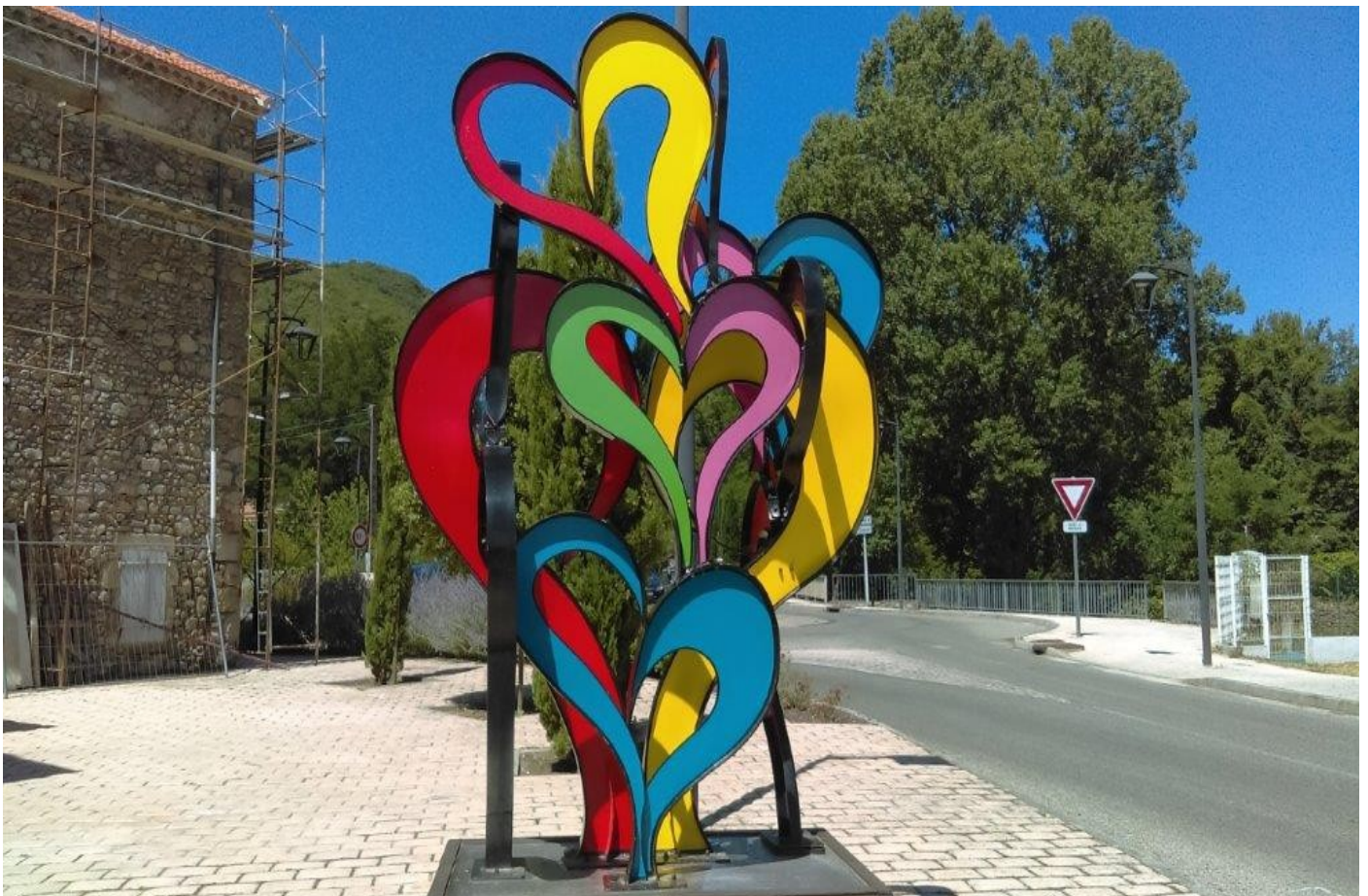
Sculpture de Jean-Pierre Dupin, artiste Bessègeois

Pour vous informer, les présentations des précédentes réunions publiques, et leurs comptes-rendus sont également disponibles en Mairie et sur le site internet de la commune. Ces éléments peuvent être complétés avec tout élément pouvant être rendu public.