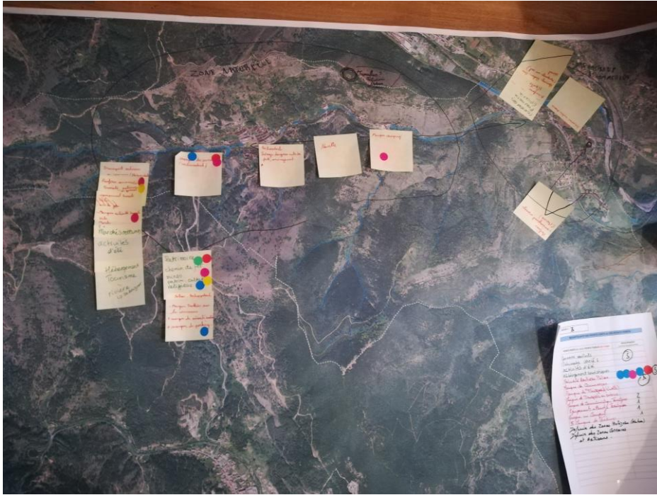
Photo du Groupe 3