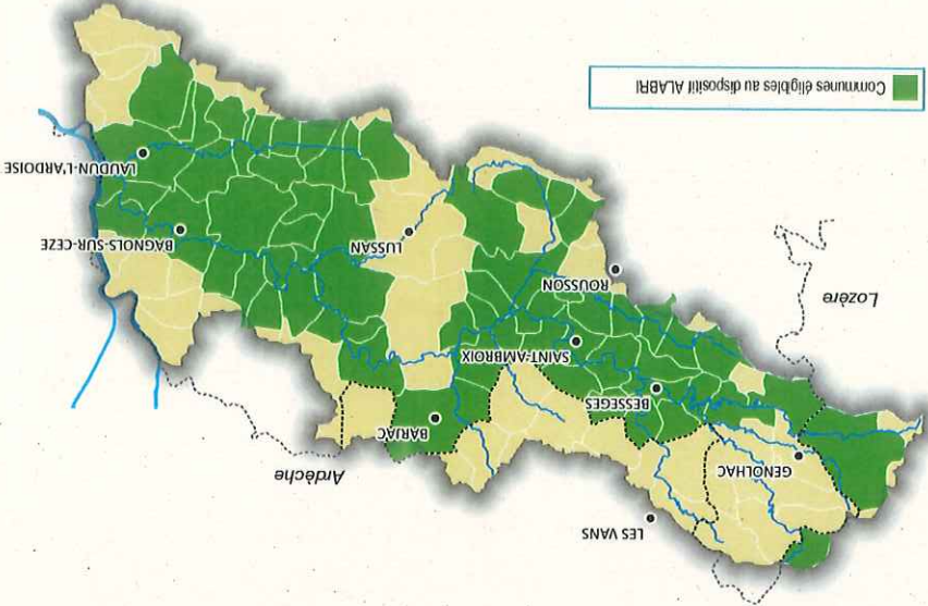
ALABRI concerne les bâtiments en zones d'aléas modéré et fort dans les communes suivantes:

Si votre habitation est en zone inondable* et située dans l'une des communes ci-dessous, vous pouvez bénéficier du dispositif ALABRI.