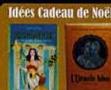
Idées Cadeau de Noël Découvrez Olympie : une révolution en 26 lames L'Oracle bleu : en édition Luxe Or

Rdv privé au : 06 15 13 17 33 ou sur place, demander Maud (entrée libre) www.didierdoryan.com